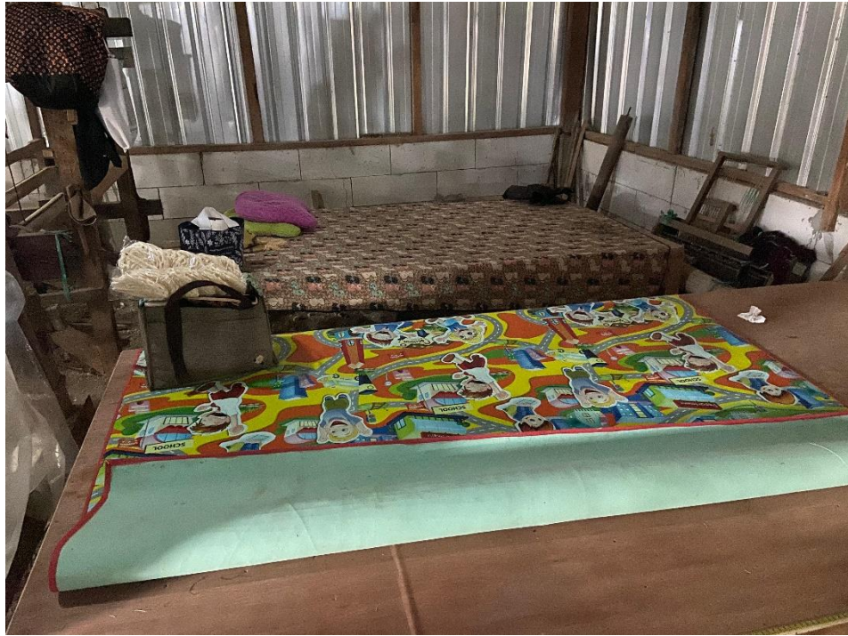
Tempat Istirahat Karyawan Tenun P24