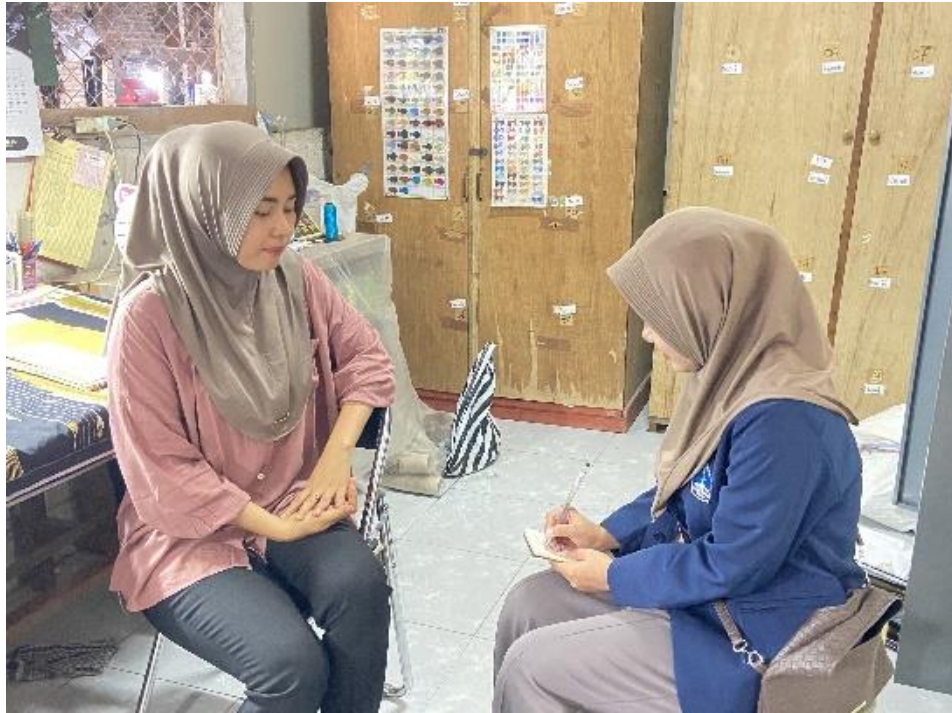
Wawancara dengan pimpinan Tenun P24 Gerih Ngawi