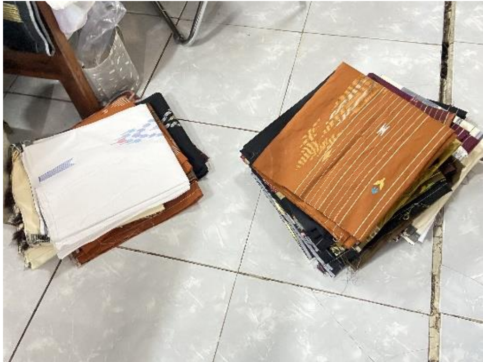
Hasil Tenun Selama 1 Minggu oleh Karyawan Tenun P24 Gerih Ngawi