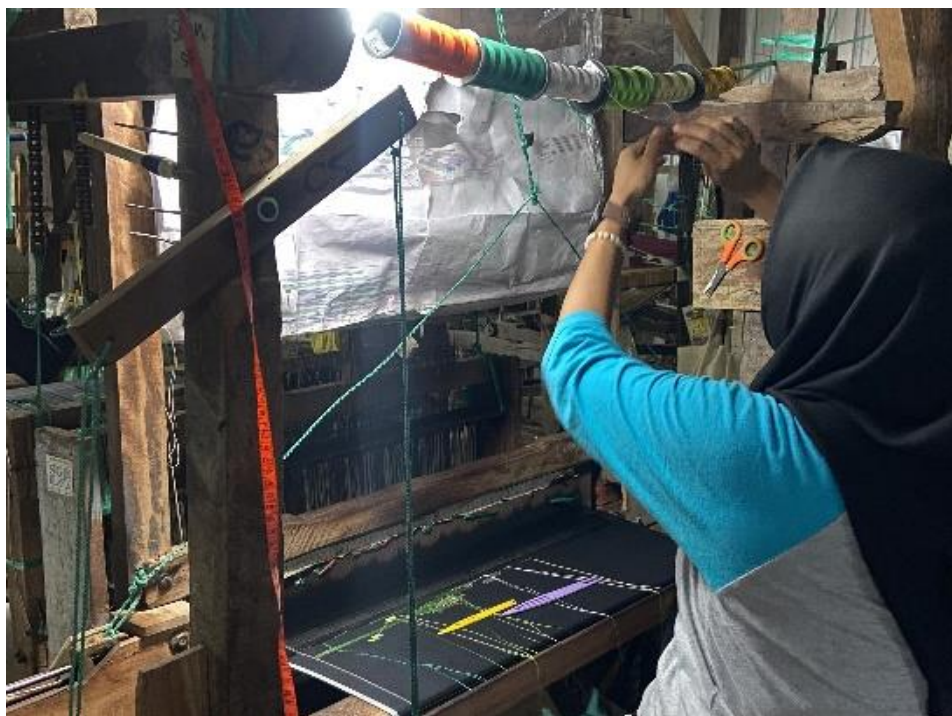
Kegiatan Menenun oleh Karyawan Tenun P24 Gerih Ngawi