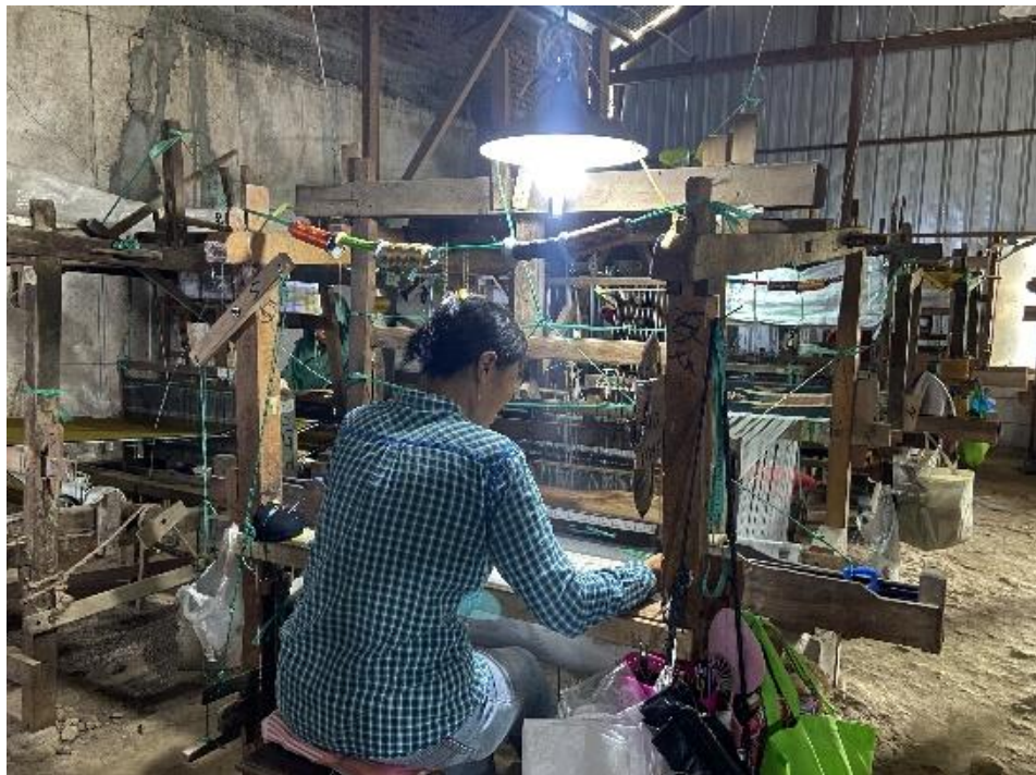
Suasan Tenun P24 Gerih Ngawi di Gedung 2