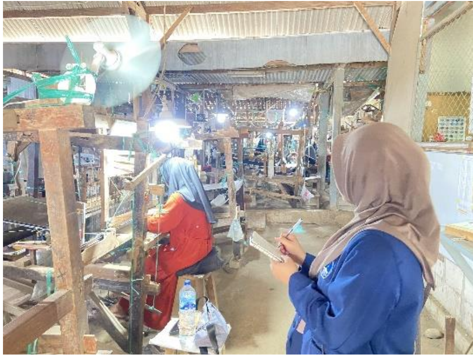
Suasana Tenun P24 Gerih Ngawi di Gedung 1