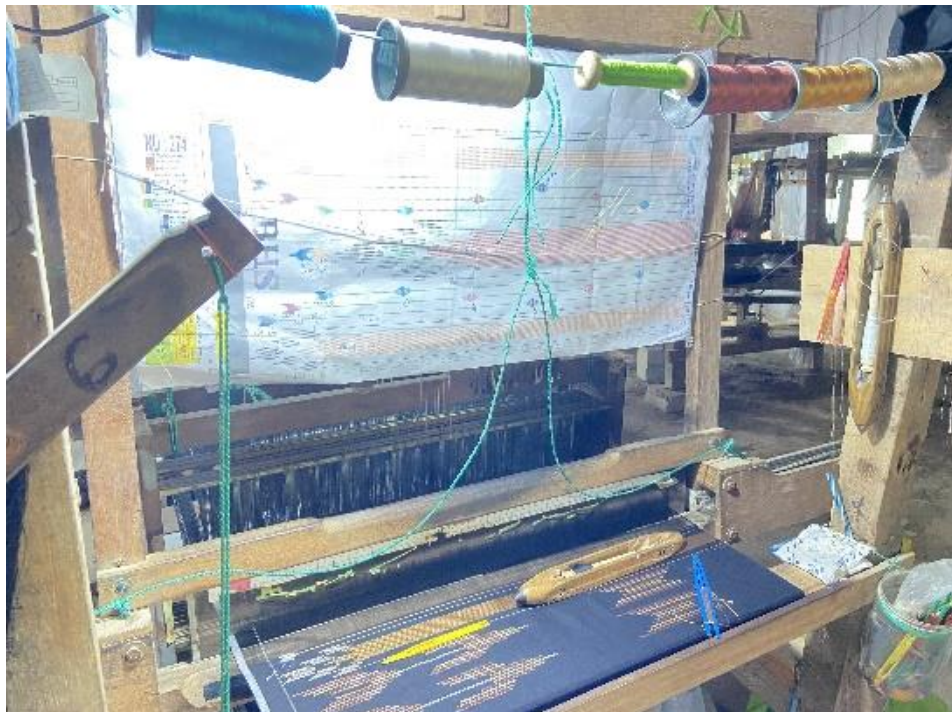
Alat Tenun Bukan Mesin (ATBM) di Tenun P24 Gerih Ngawi