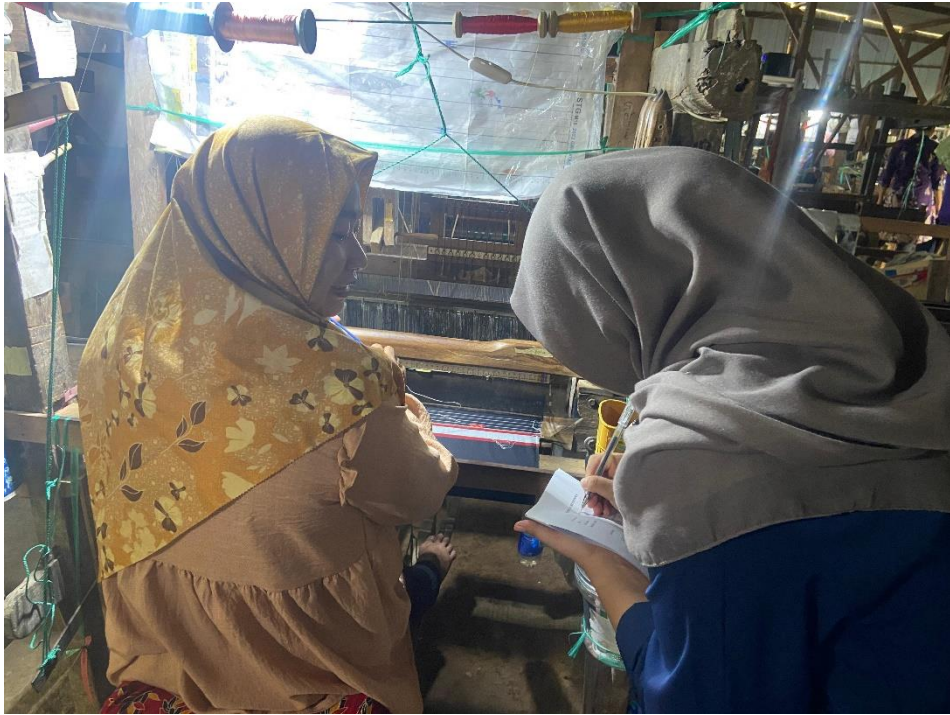
Memberikan Petunjuk Pengisian Kuesioner Sebelum diberikan Kepada Karyawan Tanun P24 Gerih Ngawi