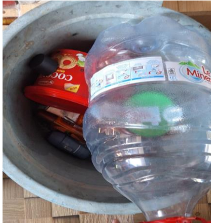
Gambar 1 :Proses pemilahan Sampah