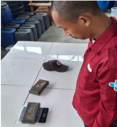
Gambar 9 : Proses Penimbangan