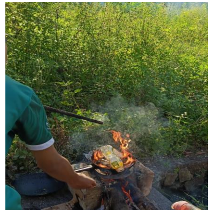
Gambar 4: Proses pembakaran sampah