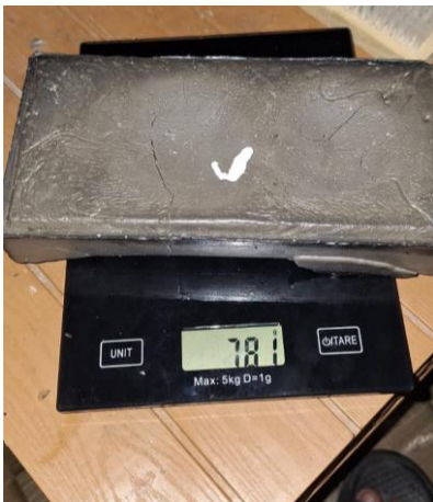
Gambar 11: Proses penimbangan