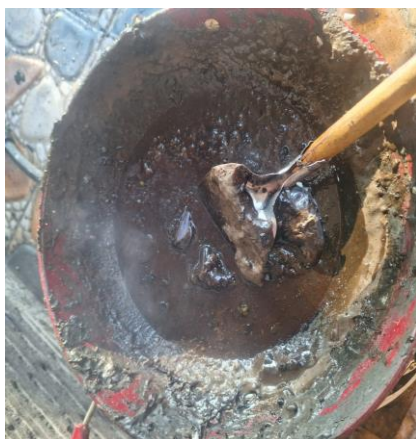
Gambar 5 :Proses pengadukan adonan