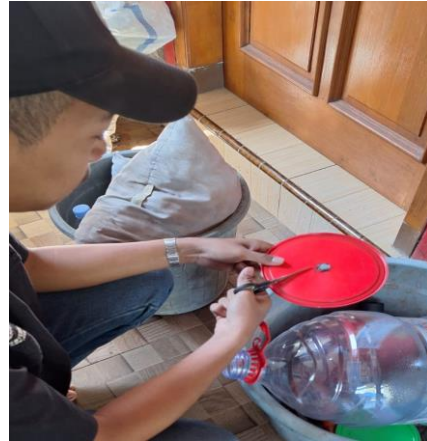
Gambar 2: Pengguntingan sampah