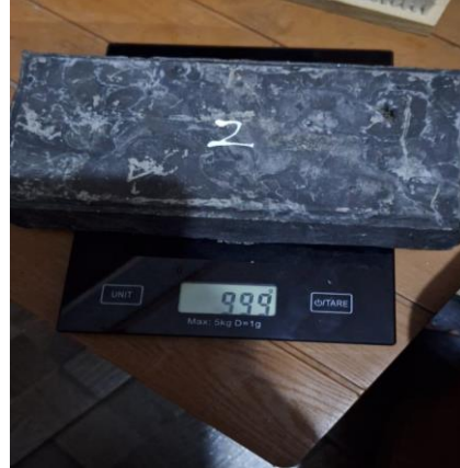
Gambar 10: Proses Penimbangan berat kering