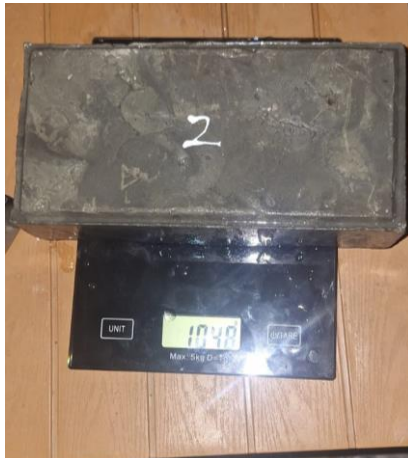
Proses penimbangan berat basah