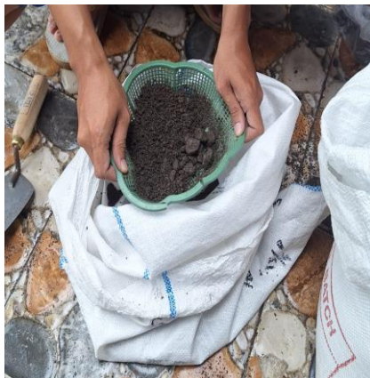
Gambar 3: Proses pengayakan sampah