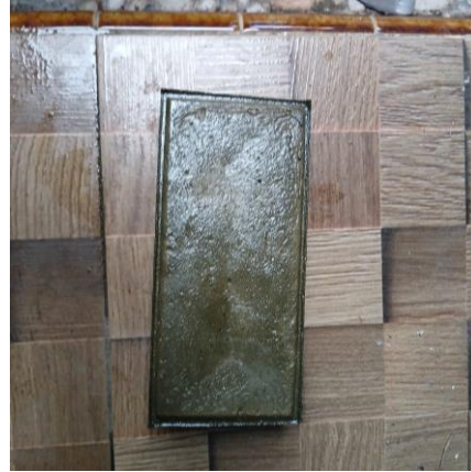
Gambar 8: Paving Jadi