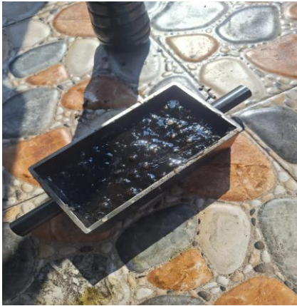
Gambar 7: Proses pencetakan