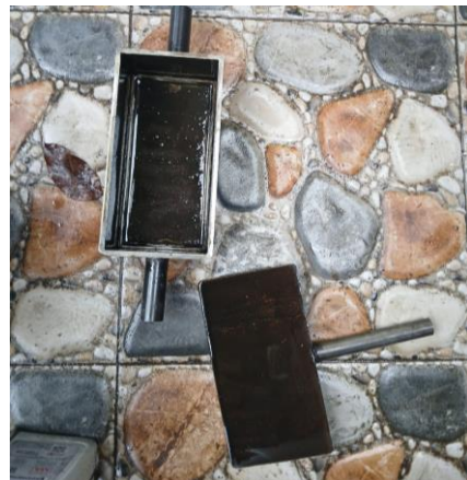
Gambar 6: Proses pengolesan cetakan