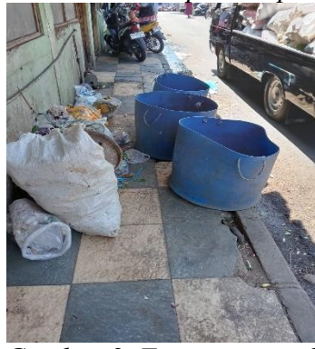
Gambar 8. Tempat sampah