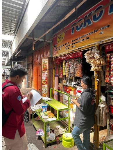
Gambar 1. Wawancara pedagang