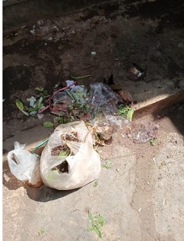
Gambar 5. Tempat sampah