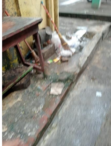
Gambar 6. Tempat sampah