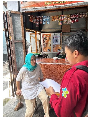
Gambar 4. Wawancara pedagang makanan