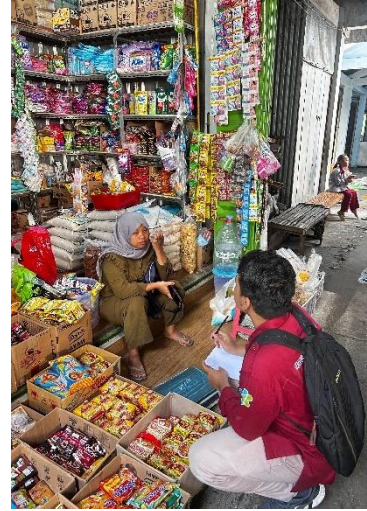
Gambar 2. Wawancara Pedagang