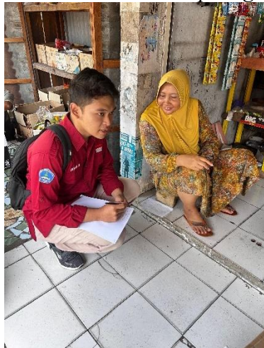
Gambar 3. Wawancara pedagang kios