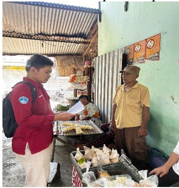
Gambar 7. Wawancara dengan petugas pasar