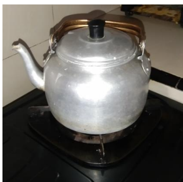
Gambar 5. Kondisi Fisik Tempat Pengolahan Air Minum