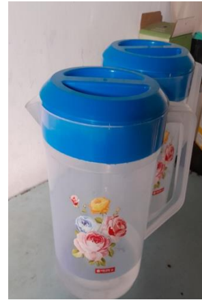
Gambar 2. Kondisi fisik wadah penyimpanan air minum responden non penderita diare