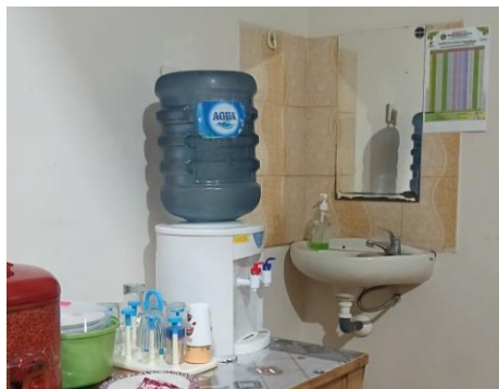
Gambar 3. Kondisi Fisik Penyimpanan Air Minum dan Tempat Cuci Tangan