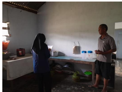
Gambar 4. Pengisian ceklist dan wawancara dengan responden