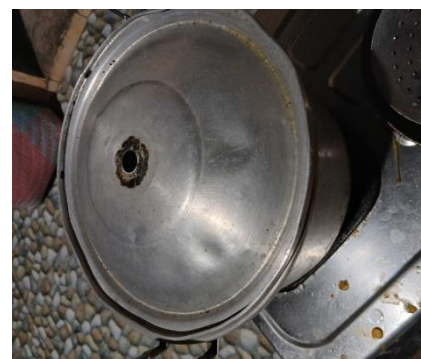
Gambar 6. Kondisi Fisik Pengolahan Air Minum Responden Penderita Diare