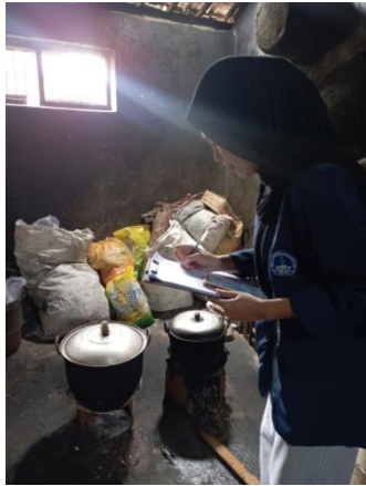
Gambar 1. Observasi dan Pengisian Ceklist