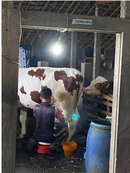
Gambar 3. Proses Pemerahan, Selama Pemerahan Pekerja Tidak Menggunakan APD