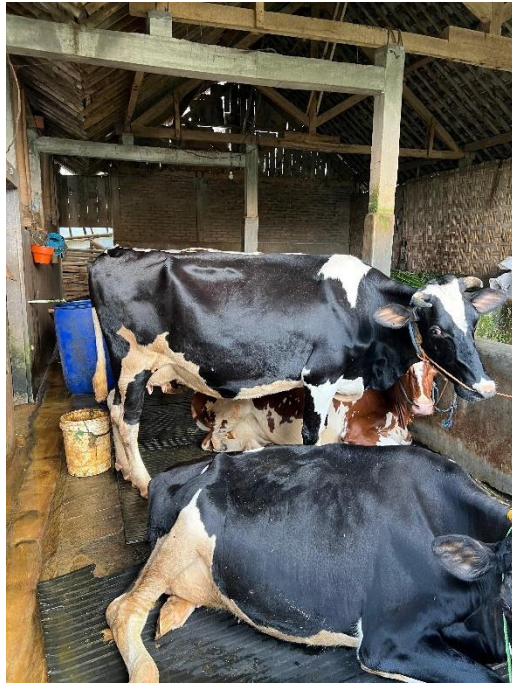
Gambar 5. Kondisi Sapi