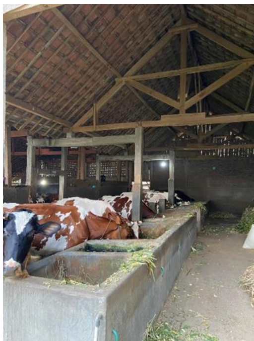
Gambar 1. Sanitasi Kandang