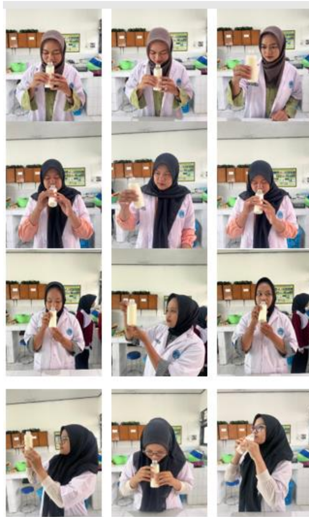
Gambar 12. Uji organoleptik pada susu segar (warna, bau, rasa, kekentalan)