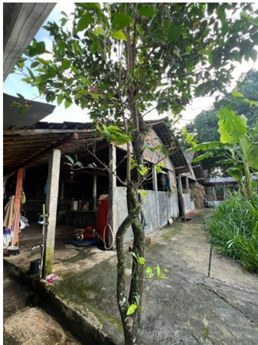
Gambar 8. Rona Lingkungan Peternakan