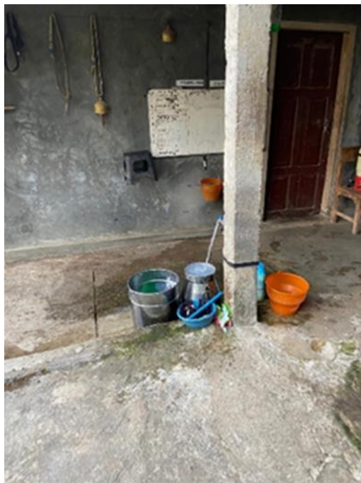
Gambar 4. Milkcan Penampung Susu Sapi Segar