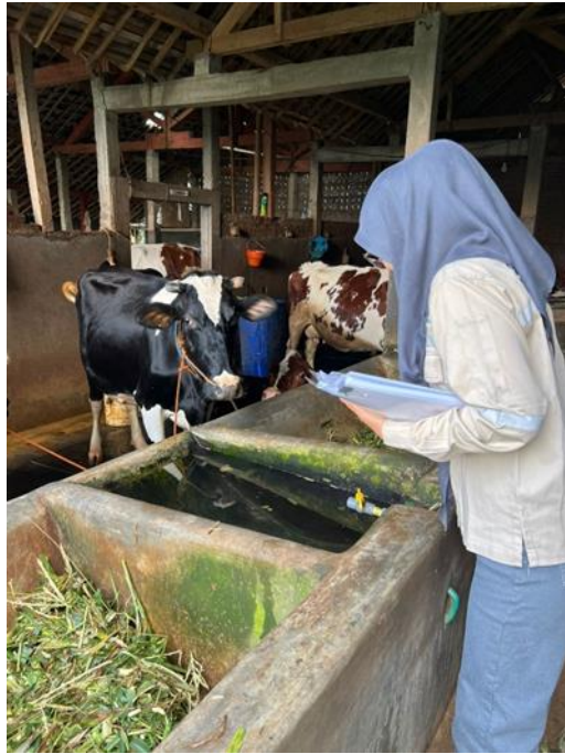
Gambar 9. Observasi Peternakan