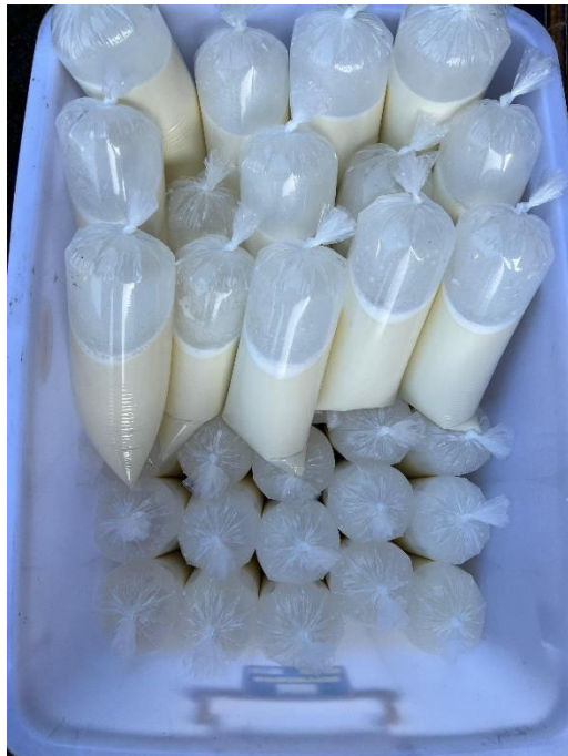
Gambar 6. Produksi Susu yang siap di distribusikan