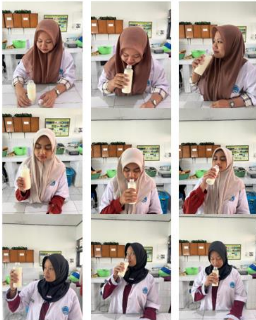
Gambar 11. Uji organoleptik pada susu segar (warna, bau, rasa, kekentalan)