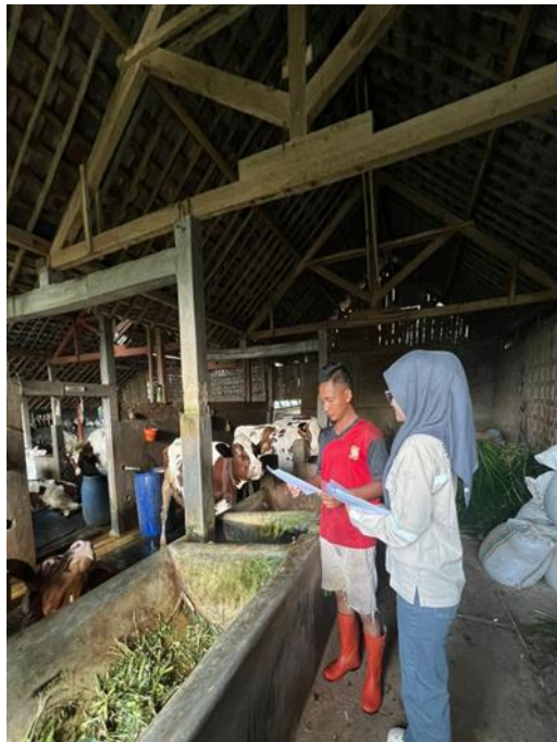
Gambar 10. Observasi dan Wawancara Dengan Responden (Pemerah)