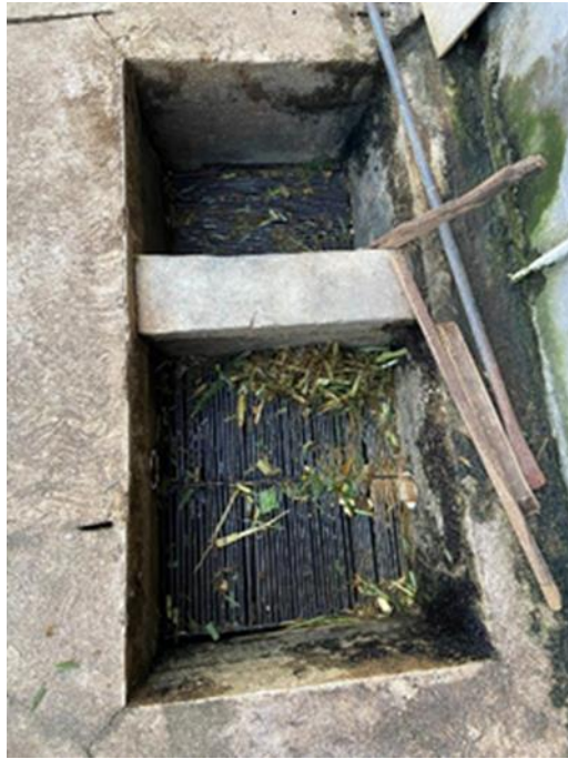
Gambar 7. Kondisi saluran atau penampungan air limbah