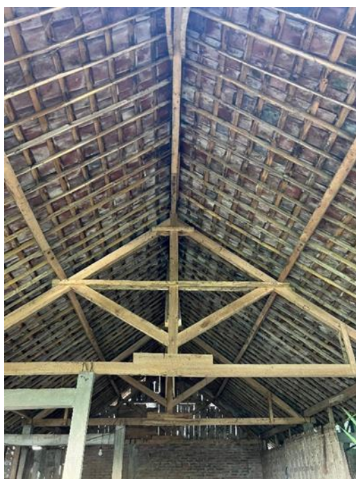
Gambar 2. Kondisi Atap