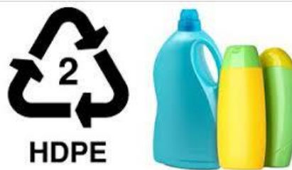
Gambar 2.3 Plastik Jenis HDPE

Plastik High Density Polyethylene (HDPE) biasanya digunakan untuk tutup botol, kantong belanja, dan botol oli. Jenis plastik ini aman untuk dikemas karena tidak bereaksi dengan makanan atau minuman yang ada di dalamnya. (Arkha, 2024)