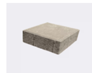
c.Paving Block Persegi