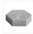
c.Paving Block Hexagon