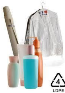
Gambar 2.5 Plastik Jenis LDPE

Plastik LDPE, terbuat dari minyak bumi, sangat tahan terhadap berbagai senyawa kimia dan uap air, tetapi kurang tahan terhadap gas seperti oksigen. (Arkha, 2024)