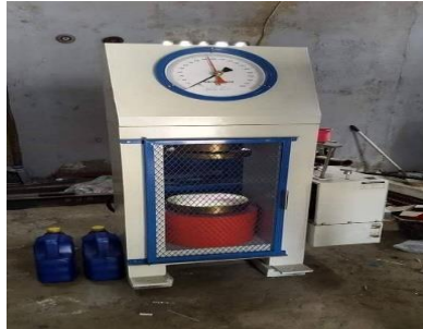
Gambar 2.11 Alat Uji Kuat Tekan (Compression Testing Machine)

Kekuatan tekan beton dapat diukur dengan melakukan uji tekan pada benda uji. Alat uji tekan yang digunakan biasanya sangat canggih, berat, dan kuat untuk memastikan kinerja dan kualitas terbaik. Alat ini dapat digunakan untuk mengukur kekuatan benda apapun ukurannya. Uji tekan memberikan informasi yang akurat tentang kemampuan bahan yang diuji, yang memungkinkan pencapaian standarisasi yang diinginkan. Selain itu, alat akan memastikan bahwa benda uji distabilkan dengan baik, yang akan menghasilkan hasil yang lebih tepat dan konsisten.