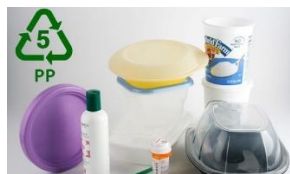
Gambar 2.6 Plastik Jenis PP

Plastik LDPE, yang dibuat dari minyak bumi, sangat tahan terhadap berbagai senyawa kimia dan uap air, tetapi kurang tahan terhadap gas seperti oksigen. (Sofiana, 2022)