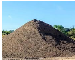
Gambar 2.8 Pasir Sungai

Pasir, dengan ukuran butiran antara 0,0625 mm dan 5 mm, adalah bahan yang sangat penting untuk membangun struktur dan memiliki kandungan utama silikon dioksida. Pasir biasanya ditemukan di alam bersama dengan kerikil dan batu. (Ummah, 2022)