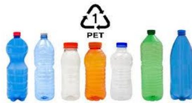
Gambar 2.2 Plastik jenis PET

PET, plastik sintetis, tidak biodegradable, tidak dapat diuraikan oleh mikroorganisme, menyebabkan masalah lingkungan. PET, atau polietilen tereftalat, memiliki titik leleh yang tinggi dan bersifat jernih atau transparan, mirip dengan botol air mineral. Plastik PET biasanya disarankan untuk digunakan sekali pakai. Tanda daur ulang pada botol plastik biasanya berbentuk segitiga dengan angka satu di tengahnya dan kata "PET" atau "PETE" di bawahnya. (Wurdiana Shinta, 2021)