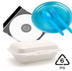
Gambar 2.7 Plastik Jenis PS