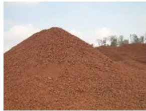
Gambar 2.10 Pasir Merah

Pasir merah, yang memiliki warna merah atau oranye, sering digunakan bersama pasir beton saat mengecor karena meningkatkan daya rekat bangunan. (Ummah, 2022)