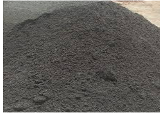
Gambar 2.9 Pasir Beton