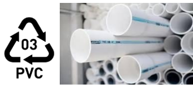
Gambar 2.4 Plastik Jenis PVC