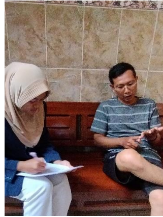
Gambar 3.3 Pengisian Kuesioner