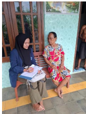
Gambar 4.3 Pengisian Kuesioner