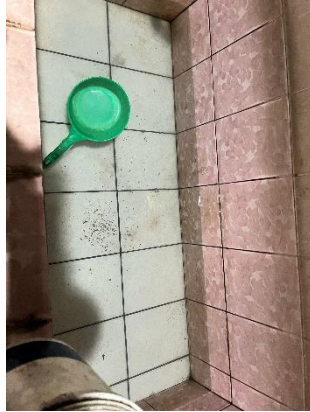
Gambar 4.1 kondisi bak mandi warga