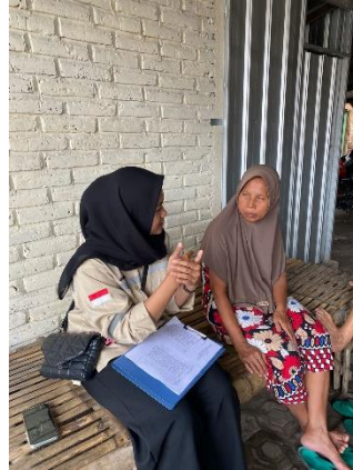
Gambar 4.2 Pengisian Kuesioner