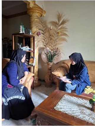
Gambar 3.2 Pengisian Kuesioner