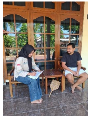
Gambar 4.4 Pengisian Kuesioner